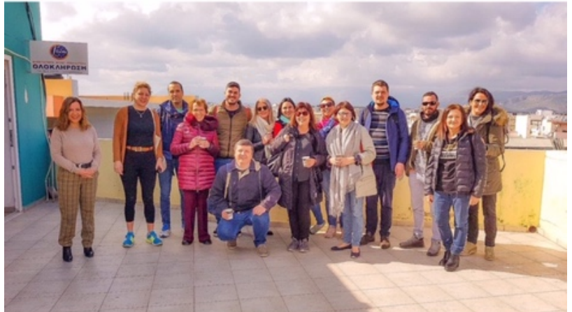
Kuva 5. Erasmus-opiskelijat.

Mitä uusiin opetusmetodeihin tulee, kurssilla opimme, että meditointi voi toimia hyvin myös opiskelijoiden kanssa. Meditoinnin avulla voidaan rauhoittua ja oppia keskittymään paremmin opetukseen. Kokeilimme meditointia hengitysharjoitusten kautta, joten tämä voisi olla yksi kokeilun arvoinen tekniikka opetuksessa. Tämä toki voisi tukea myös henkilöstön hyvinvointia.