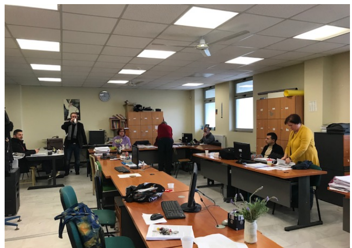
Kuva 2: Iraklionissa sijaitsevan yläkoulun opettajainhuone.

Kurssiin sisältyi myös kouluvierailu paikallisessa yläkoulussa. Koulussa oli opiskelijoita ikäluokista 15-18. Itse pääsin seuraamaan kahta englannin tuntia, joista toisessa me opettajat olimme enemmän äänessä. Toisella tunnilla näin, miten opetus paikallisessa koulussa tapahtuu. Olin ehkä jopa hieman yllätynyt siitä, ettei koulussa ole minkäänlaista tietotekniikkaa – edes opettajalla luokassa. Koulussa on tietokoneita muutamia opettajainhuoneessa muttei minkäänlaista teknologiaa luokissa. Vaikka lähtökohdat opetukselle ovatkin täysin