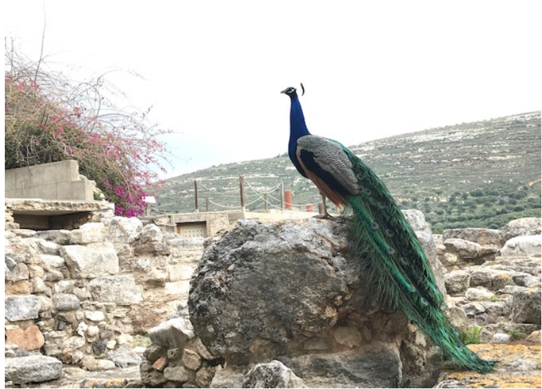
Kuva 4. Knossoksella saattoi myös nähdä riikinkukkoja käyskentelemässä.

Mikä myös hämmästytti italialaisia opettajia, oli se, että opettajat Suomessa saavat vapaasti suunnitella oppituntinsa ja opetusmetodinsa. Heillä on kertomansa mukaan paljon tiukempaa ja tarkat suunnitelmat on tarjottava etukäteen johdolle. Nämä seikat antavat hyvin perspektiiviä omaan työhön ja kulttuuriin. Mieleeni useasti tämän viikon aikana tulikin korni lausahdus: ”Kyllä meillä on Suomessa asiat hyvin.” Näinhän se on.