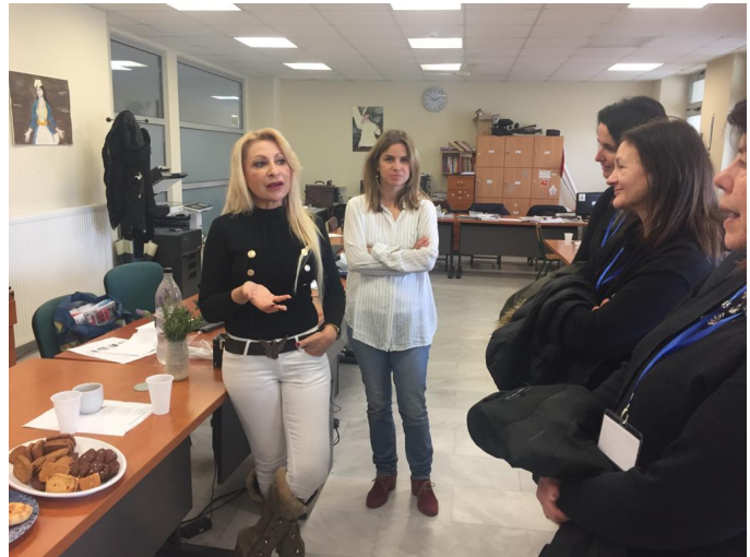
Kuva 3. Englannin opettajat esittelivät meille koulua ja pääsimme heidän oppitunneilleen vieraiksi.

Kurssin järjestäjällä oli samaan aikaan kolme muutakin kurssia käynnissä ja kaikkiaan kursseille osallistuvia oli 12. Vietimme usein aikaa tauoilla ja kurssien jälkeen iltaisin yhdessä. Olimmekin hyvin tiivis porukka, ja keskustelimme paljon omien kulttuuriemme koulutusjärjestelmistä. Osallistujia oli lisäksi Espanjasta, Italiasta, Ruotsista ja Latviasta. Moni tuntui myös olevan kiinnostunut tulevaisuudessa yhteistöistä, mikä on mielestäni todella hieno ajatus. Koenkin, että tämän viikon pituisen kurssin tärkeimpiä antimia ovat olleet juurikin verkostot, joita onnistuin luomaan.